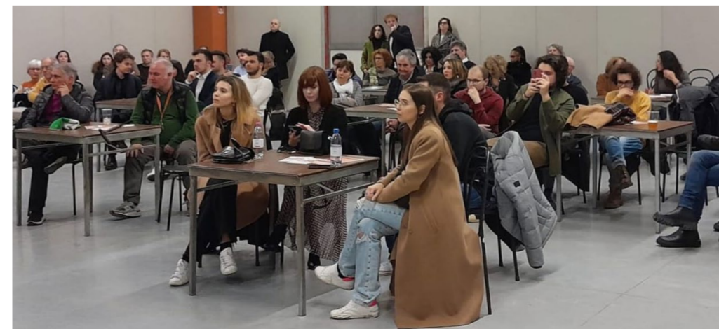
Tante persone al Salone delle Feste in occasione della nascita del circolo GD

Intendiamo non solo dare una mano e supportare il PD nelle sue iniziative e nelle sue campagne elettorali ma anche portare lo spirito critico, le visioni del mondo e l'attitudine alla politica proprie della nostra generazione arricchendo il dibattito e portando istanze diverse nel dibattito politico interno. Senza peccare di presunzione e dando ascolto all'ormai noto mantra che ci vede come "il futuro", il circolo dei Giovani Democratici di Correggio sceglie e si prepone di accettare la sfida e di prendere il posto che ci è stato riservato da una leadership condivisa del partito correggese molto attenta e disponibile nei nostri confronti. C'è poi una componente diciamo di reazione nella fondazione del circolo, dettata e quasi resa necessaria dagli eventi